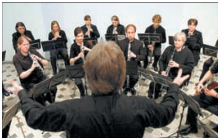
Die Camerata Auletica spielt in der Kirche St. Oswald.

In Frankreich, der eigentlichen Geburtsstätte der Oboe, wurde die Tradition jedoch weiter gepflegt. Bis heute haben sich dort die Oboen-Consorts gehalten. Um auch ausserhalb Frankreichs die schon fast vergessenen Trouvailles der für diese Besetzung existierenden Lite-